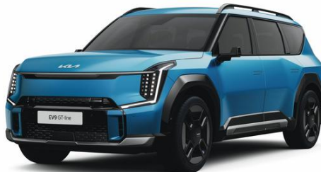
Ocean Blue (OBM) matowy, nieдоступny dla Earth