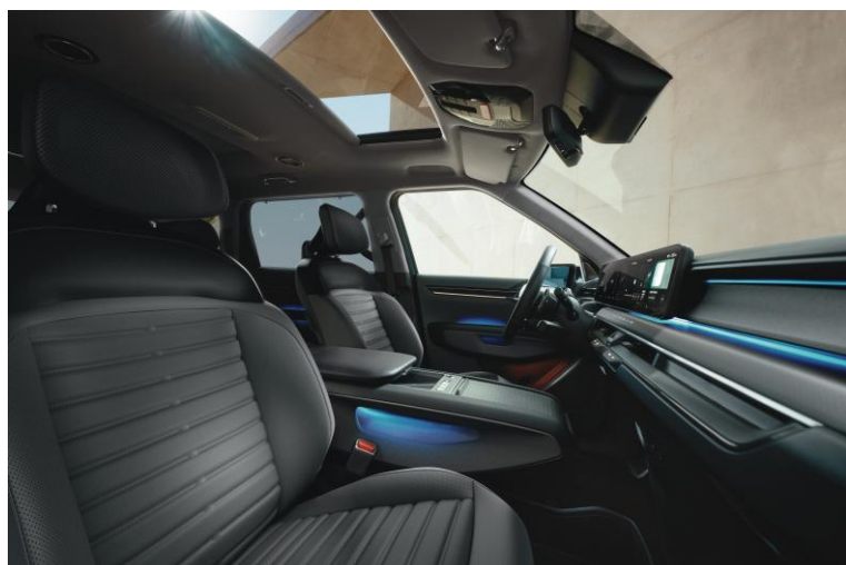
Wersja Earth wnętrze RBQ, opcja CP1