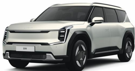
Ivory Silver (ISM) matowy, nieдоступny dla GT-Line