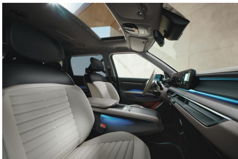
Wersja Earth wnętrze EMA, opcja CP1