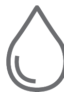
Zużycie paliwa 7,4-7,6 l/100 km