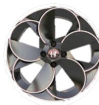
18" Felgi aluminiowe Diamond Cut Kod opcji 1M5