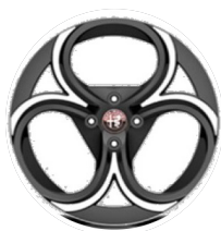
18" Felgi aluminiowe Progressive Kod opcji WP8