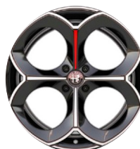
20" Felgi aluminiowe Perfo Kod opcji 5RK