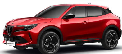
136 CZERWONY - BRERA