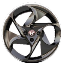
17" Felgi aluminiowe Diamond Cut Kod opcji 1M3