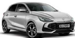
SREBRNY „COSMIC SILVER” (metalik)