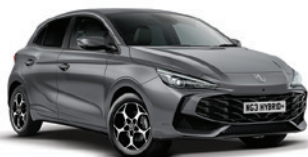
SZARY „HAMPSTEAD GREY” (metalik)