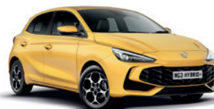
ŻÓŁTY „PASTEL YELLOW” (standard)

* Lakier trójwarstwowy i metaliczny dostępne za dodatkową opłatą.