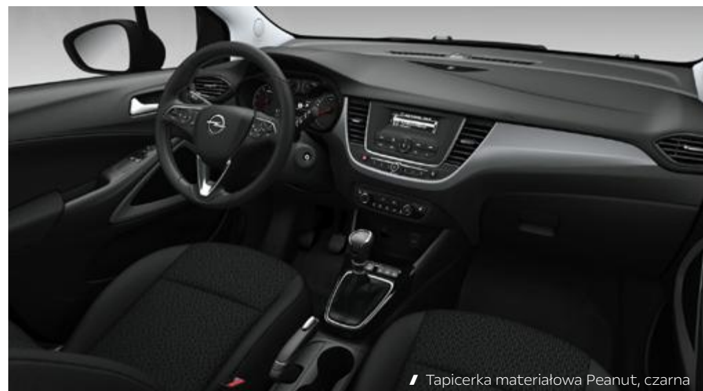
// Tapicerka materiałowa Peanut, czarna