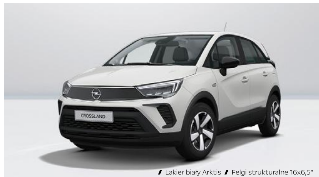
// Lakier biały Arktis // Felgi strukturalne 16x6,5"