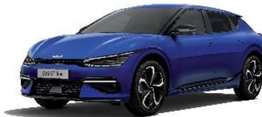
Yacht Blue metalik, (DU3)