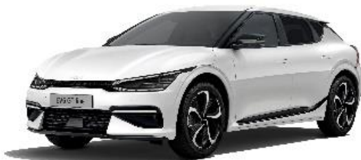
Snow White Pearl metalik, (SWP)