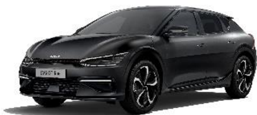
Aurora Black Pearl metalik, (ABP)