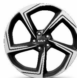
21" felgi aluminiowe z oponami w rozmiarze 255/40/R21