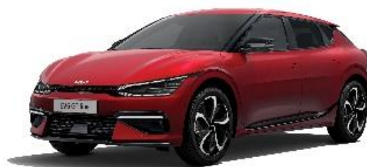
Runway Red metalik, (CR5)