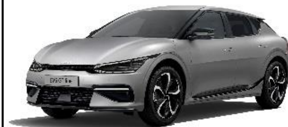
Moon Scape Matte lakier specjalny metalik, (KLM)