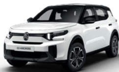
PERLA NERA BLACK z lakierem POLAR WHITE