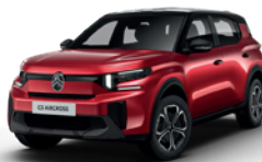
PERLA NERA BLACK z lakierem ELIXIR RED