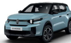
PERLA NERA BLACK z lakierem BLEU MONTE CARLO

● - Standard - - nie występuje P - pakiet opcji