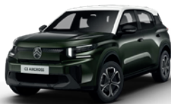
OPAL WHITE z lakierem MONTANA GREEN