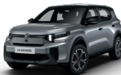
PERLA NERA BLACK z lakierem MERCURY GREY