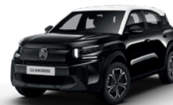
OPAL WHITE z lakierem PERLA NERA BLACK