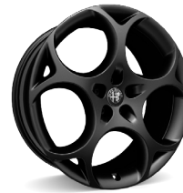
21" Felgi aluminiowe Modale Dark Kod opcji 3ET