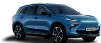
Niebieski „Arctic Blue” (metalik)

Przygotuj się na to, że będziesz przyciągać uwagę.