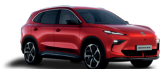
Czerwony „Diamond Red” (trójwarstwowy)

* Lakiery trójwarstwowy i metaliczny dostępne za dodatkową opłatą.