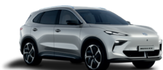
Srebrny „Cosmic Silver” (metalik)