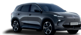
Szary „Hampstead Grey” (metalik)