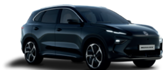
Czarny „Pebble Black” (metalik)