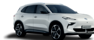
Biały „Dover White” (standard)