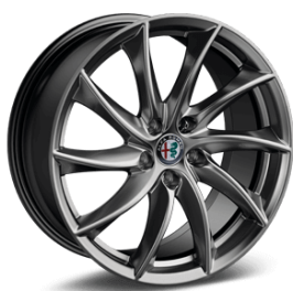
18" Felgi aluminiowe Sport Silver Matt Kod opcji 3CO

Oznaczenia w cenniku: podane kwoty w zł z VAT / ■ wyposażenie standardowe / - wyposażenie niedostępne / P wyposażenie dostępne w pakiecie