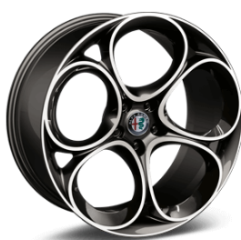
19" Felgi aluminiowe Sport Design Dark Glossy Kod opcji 3CX