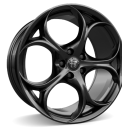
19" Felgi aluminiowe Modale Dark Kod opcji 3CV