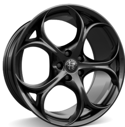
19" Felgi aluminiowe Modale Dark Kod opcji 3DB