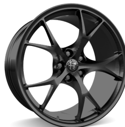
19" Felgi aluminiowe Exclusive Dark Kod opcji 3DA