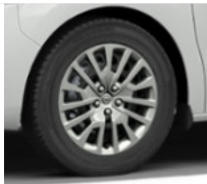
Felgi stalowe 17x70