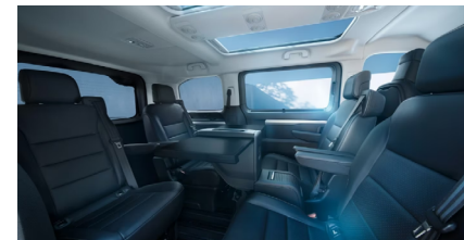
4 siedzenia ze stolikiem AN01