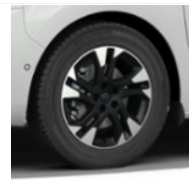
Felgi aluminiowe 17x70