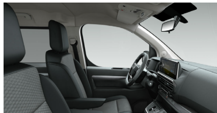
Tapicerka Rimini BRFY