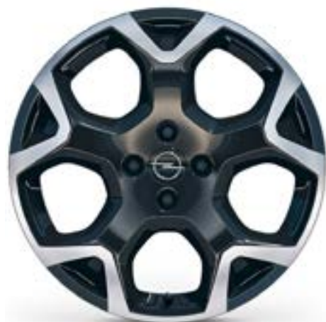
18" / ZHQ1 Opcja dla: GS