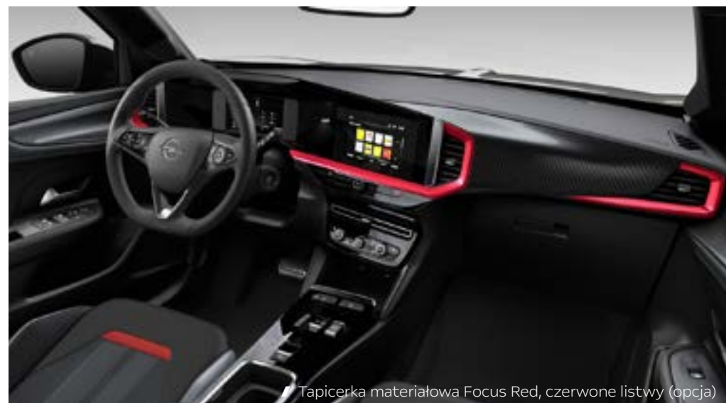
// Tapicerka materiałowa Focus Red, czerwone listwy (opcja)