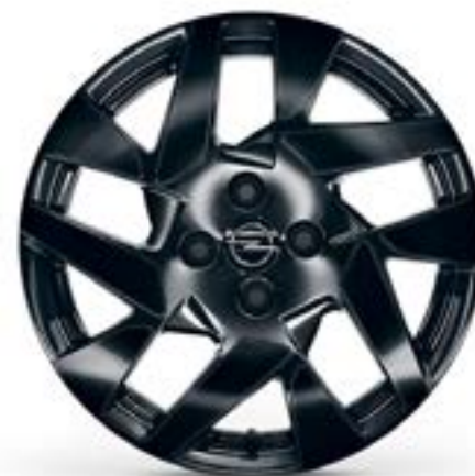
17" / ZHP9 Standard dla: GS