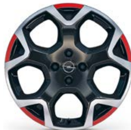
18" / ZHA3 Opcja dla: GS