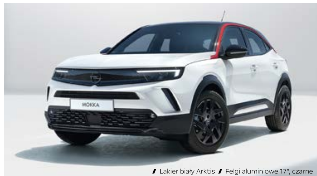
// Lakier biały Arktis // Felgi aluminiowe 17", czarne