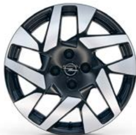
17" / ZHP8 Standard dla: Edition