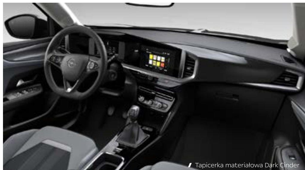
// Tapicerka materiałowa Dark Cinder