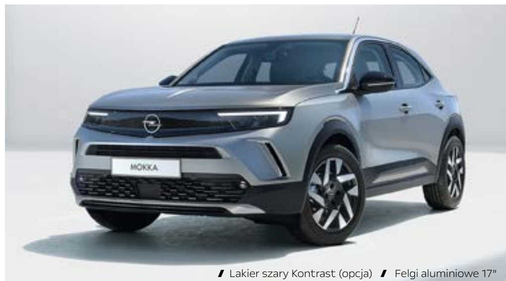
// Lakier szary Kontrast (opcja) // Felgi aluminiowe 17"