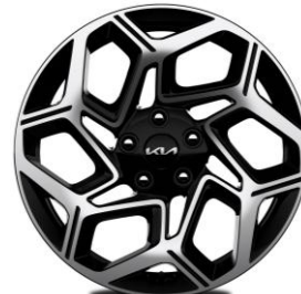
18-calowe felgi aluminiowe, wersja GT-Line