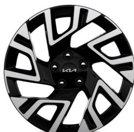
18-calowe felgi aluminiowe, wersja M (opcja), L, Tribute, Business Line