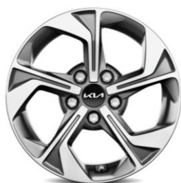
16-calowe felgi aluminiowe, wersja M