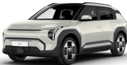
Ivory Silver (ISG) metalizowany