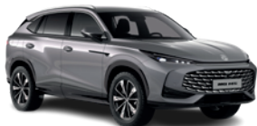
Szary „Hampstead Grey” (metalik)

Wybierz wariant wyposażenia: Excite, Exclusive, i przyciągaj spojrzenia, gdziekolwiek pojedziesz.