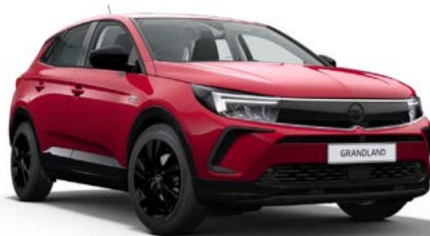
// Lakier czerwony Karmin (opcja)