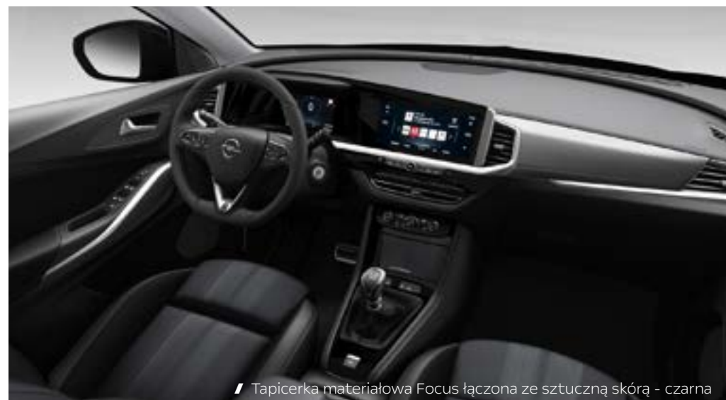
// Tapicerka materiałowa Focus łączona ze sztuczną skórą - czarna