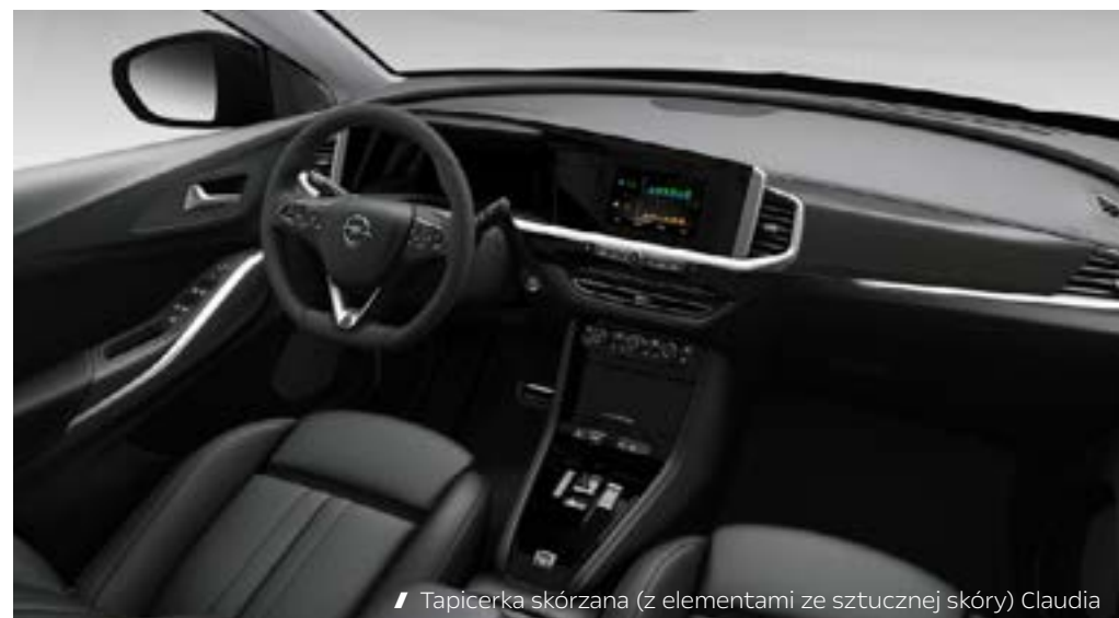
/ Tapicerka skórzana (z elementami ze sztucznej skóry) Claudia