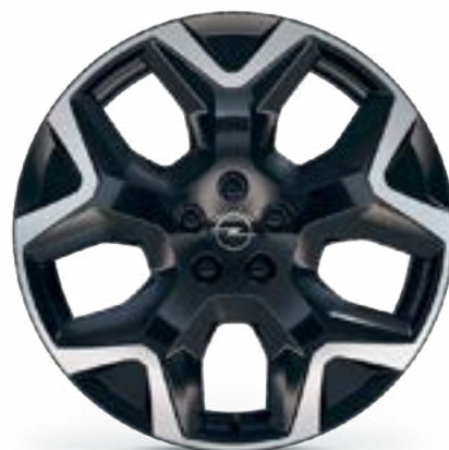
19" / IRONMAN (ZHVK)

Standard dla: GS Advanced i GS Advanced Leather Opcja dla: GS Light