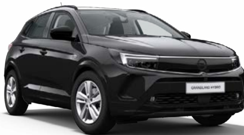
/ Lakier czarny Karbon (standard)