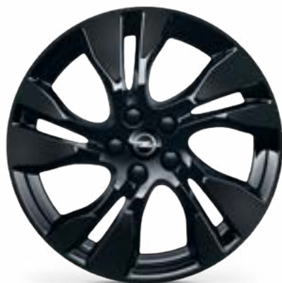
18" / MANTA (ZHEB)