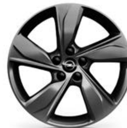
18" / OMEGA (MI28)

Standard dla: GS Advanced i GS Advanced Leather Opcja dla: GS Light