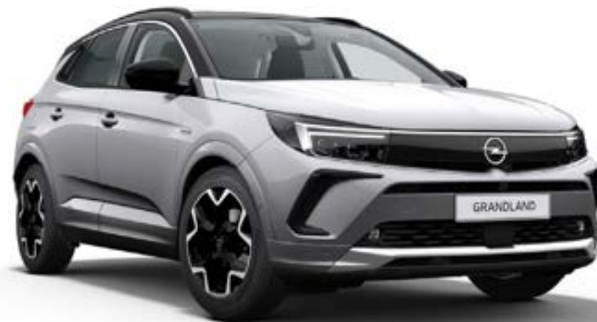
// Lakier szary Kontrast (opcja)