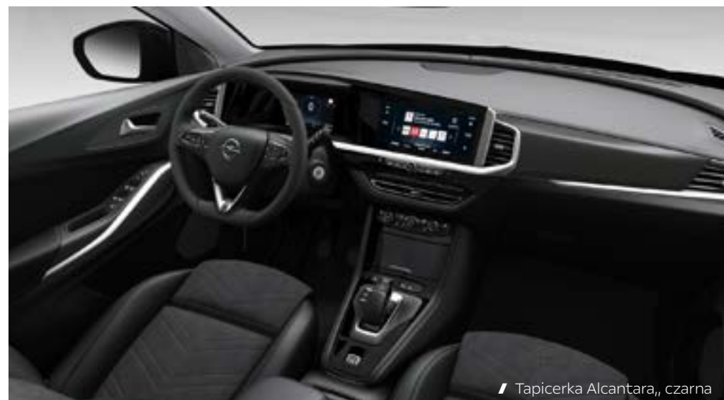
// Tapicerka Alcantara,, czarna