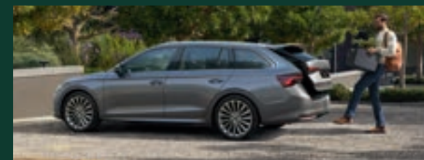
Bezdotykowe otwieranie i zamykanie elektrycznie sterowanej pokrywy bagażnika