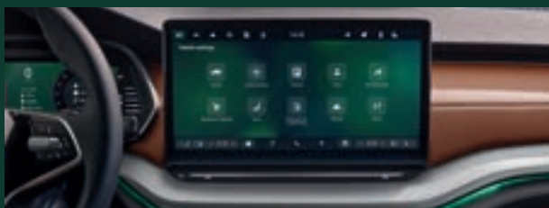
Wyświetlacz Infotainment 13" z nawigacją