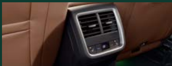
Climatronic automatyczna 3-strefowa klimatyzacja z regulacją elektroniczną