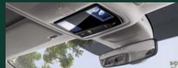
Port USB-C - umieszczony w lusterku wewnętrznym samochodu