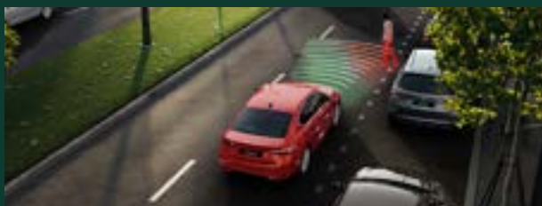
Front Assist – kontrola odstępów z funkcją awaryjnego hamowania