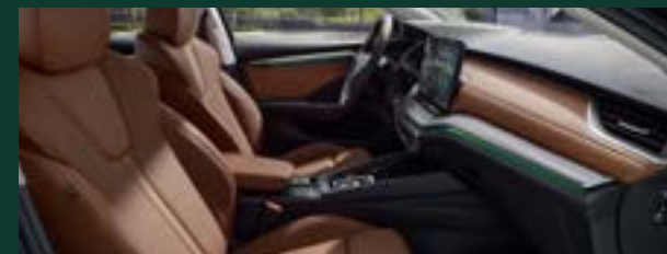
Komfort podróży - ergonomiczne siedzenia z certyfikatem AGR