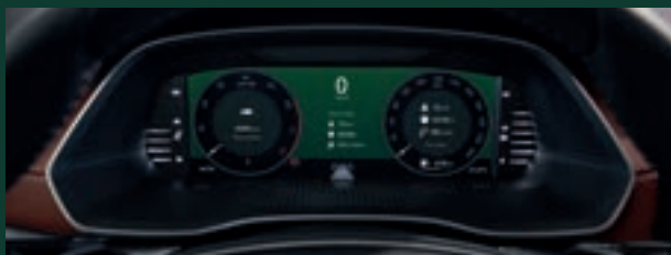
Virtual Cockpit - cyfrowy zestaw wskaźników