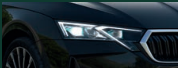
Oświetlenie LED - reflektory TOP LED Matrix