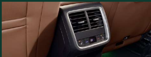
Climatronic automatyczna 3-strefowa klimatyzacja z regulacją elektroniczną