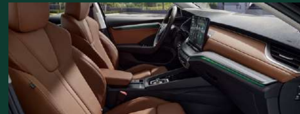
Komfort podróży - ergonomiczne siedzenia z certyfikatem AGR