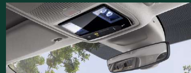
Port USB-C - umieszczony w lusterku wewnętrznym samochodu