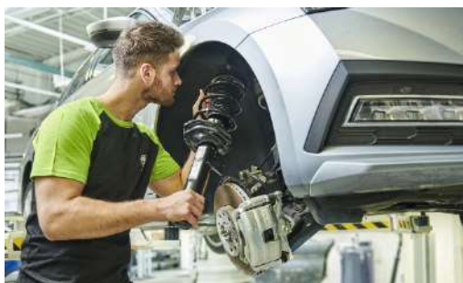
Pakiet przeglądów: 1 wymiana oleju + 1 przegląd okresowy (bez wymiany oleju)

W ramach Pakietów Przeglądów otrzymujesz opłacone przeglądy okresowe (robocizna, oryginalne części i materiały eksploatacyjne, zgodnie z planem serwisowym).