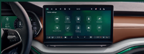
Wyświetlacz Infotainment 13" z nawigacją