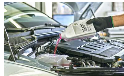
Pakiet przeglądów: 2 wymiany oleju + 2 przeglądy okresowe (bez wymiany oleju)