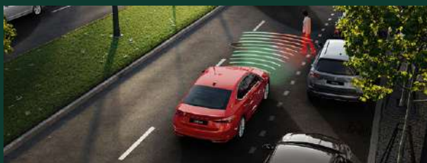
Front Assist - kontrola odstępów z funkcją awaryjnego hamowania