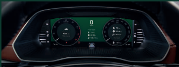
Virtual Cockpit - cyfrowy zestaw wskaźników