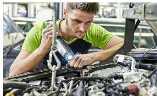
Pakiet przeglądów: 2 wymiany oleju + 1 przegląd okresowy (bez wymiany oleju)