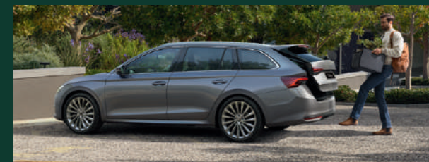
Bezdotykowe otwieranie i zamykanie elektrycznie sterowanej pokrywy bagażnika