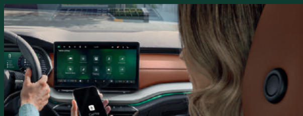
Funkcja SmartLink - połączenie przewodowe/ bezprzewodowe dla urządzeń Apple iOS*