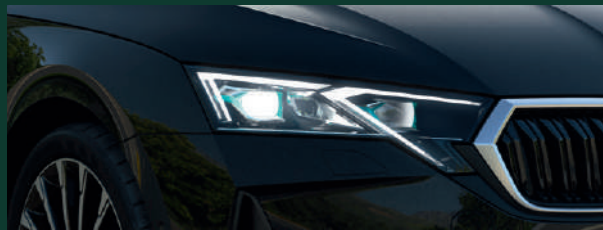
Oświetlenie LED - reflektory TOP LED Matrix