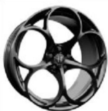
20-calowe ciemne aluminiowe obręcze kół z 5 otworami Modale Dark

Kształt i rozmiar tych obręczy został dobrany tak, aby zapewnić maksymalne osiągi, a jednocześnie uchwycić odważny, unikalny styl Alfa Romeo.