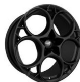
21-calowe ciemne aluminiowe obręcze kół z 5 otworami Exclusive Modale Dark