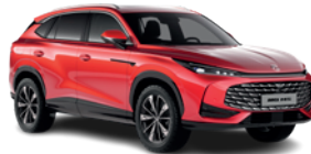
Czerwony „Diamond Red” (trójwarstwowy)