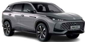
Szary „Hampstead Grey” (metalik)

Wybierz wariant wyposażenia: Excite, Exclusive, i przyciągaj spojrzenia, gdziekolwiek pojedziesz.