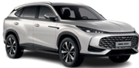
Srebrny „Sterling Silver” (metalik)