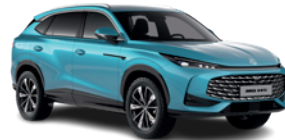
Niebieski „Arctic Blue” (standard)