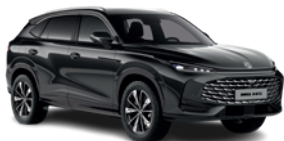
Czarny „Pebble Black” (metalik)