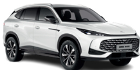
Biały „Pearl White” (perłowy)

* Lakiery trójwarstwowy, metaliczny i perłowy dostępne za dodatkową opłatą.